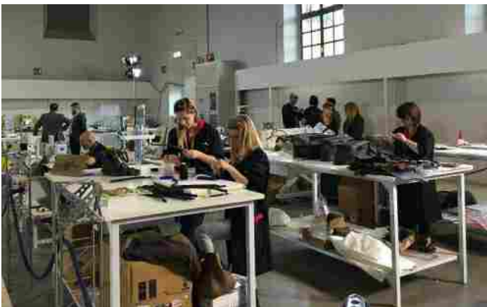
Lavorazione della pelle a Pellepiù di Firenze

Venerdì, 13 Maggio 2016 10:31 Scritto da Davide Lacangellera dimensione font